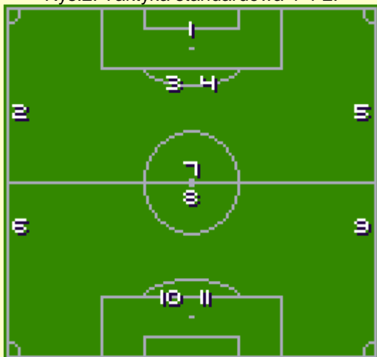
Rys.2. Taktyka standardowa 4-4-2.